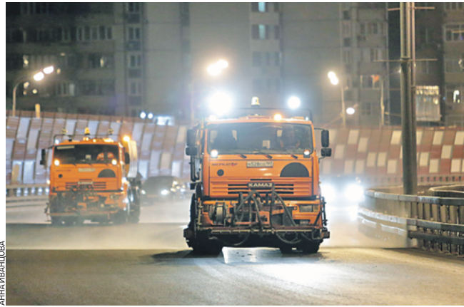
28 сентября 02.47 Живописный мост — в числе первых, обработанных противогололедным реагентом