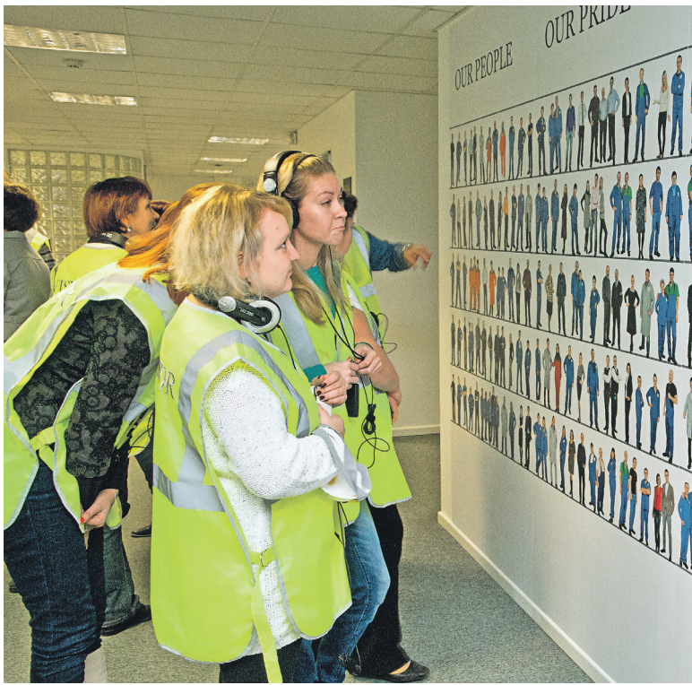
«Стена гордости» на фабрике «Лигgett-Дукат».

Порядок на рабочих местах позволяет освободить время для умственной деятельности и творчества. На фабрике уже много лет действует «Система предложений» - каждый сотрудник может вносить в специальную электронную систему свои предложения по улучшению любых рабочих процессов. Авторы конструктивных предложений получают ценные призы.