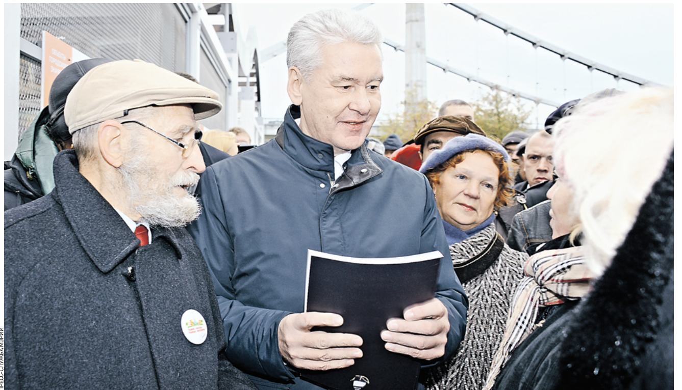
30 сентября 17.23 Крымская набережная Москвы-реки. Мэр Москвы Сергей Собянин (в центре) рассказывает местным жителям о планах благоустройства столицы