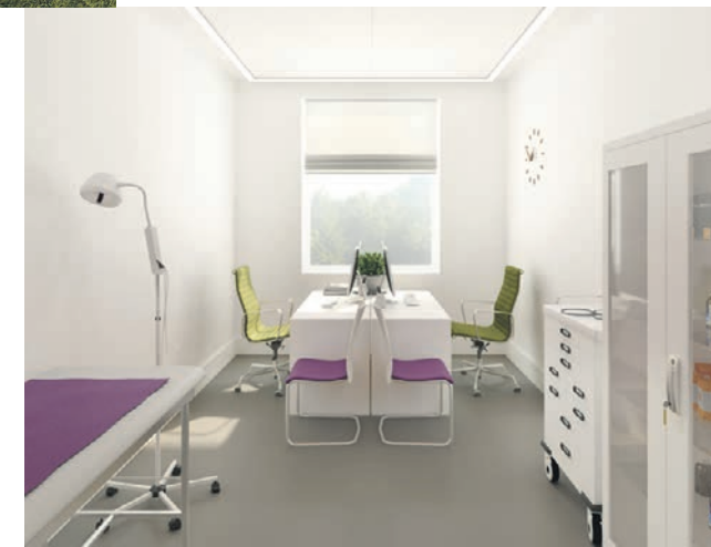
Проект планировки кабинетов в поликлиниках после капитального ремонта. Их сделают светлыми и удобными для приема пациентов

На время проведения капитального ремонта вся медицинская помощь останется такой же доступной, как была раньше. Жители не только продолжат ходить к своим знакомым врачам, но и смогут записываться к ним удаленно, просто временно прием будет вестись в другом здании. Вот что го-