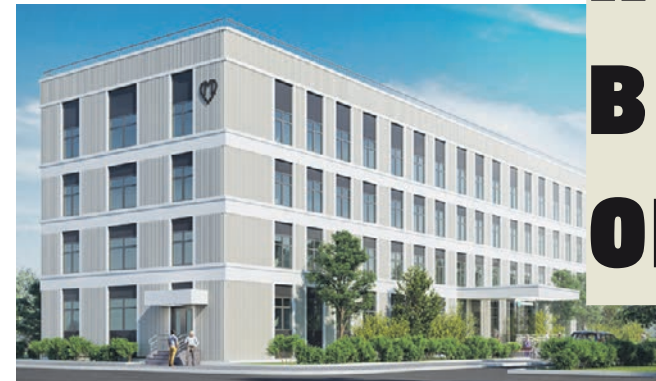
Проект реконструкции детской городской поликлиники № 23 (филиал 2)

объединил в себе стандарты и правила, затрагивающие все аспекты работы поликлиник. Новый стандарт — это удобство и комфорт для пациентов и врачей, высокая доступность самых нужных специалистов, современные технологии для диагностики и профилактики болезней. Поликлиники станут лучше, а москвичи почувствуют к себе особое отношение. В соответствии с новым стандартом в каждом здании будут применены новые принципы зонирования, согласно которым наиболее посещаемые кабинеты размещаются на нижних этажах, а наименее посещаемые и административные кабинеты — на верхних. Кабинеты, в которых врачи будут вести прием пациентов, будут оборудованы эргономичной мебелью, так-