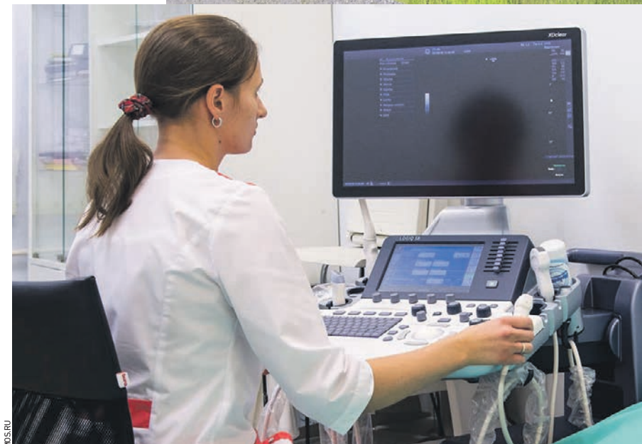
Специалист УЗИ одной из столичных поликлиник готовится к осмотру пациента

объединил в себе стандарты и правила, затрагивающие все аспекты работы поликлиник. Новый стандарт — это удобство и комфорт для пациентов и врачей, высокая доступность самых нужных специалистов, современные технологии для диагностики и профилактики болезней. Поликлиники станут лучше, а москвичи почувствуют к себе особое отношение. В соответствии с новым стандартом в каждом здании будут применены новые принципы зонирования, согласно которым наиболее посещаемые кабинеты размещаются на нижних этажах, а наименее посещаемые и административные кабинеты — на верхних. Кабинеты, в которых врачи будут вести прием пациентов, будут оборудованы эргономичной мебелью, так-