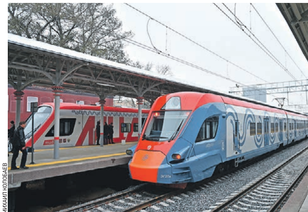
8 ноября 2019 года. На Московских центральных диаметрах будут курсировать новые современные поезда «Иволга»

Пользователи портала «Активный гражданин» выберут районы, в которых необходимо установить станции велопроката.