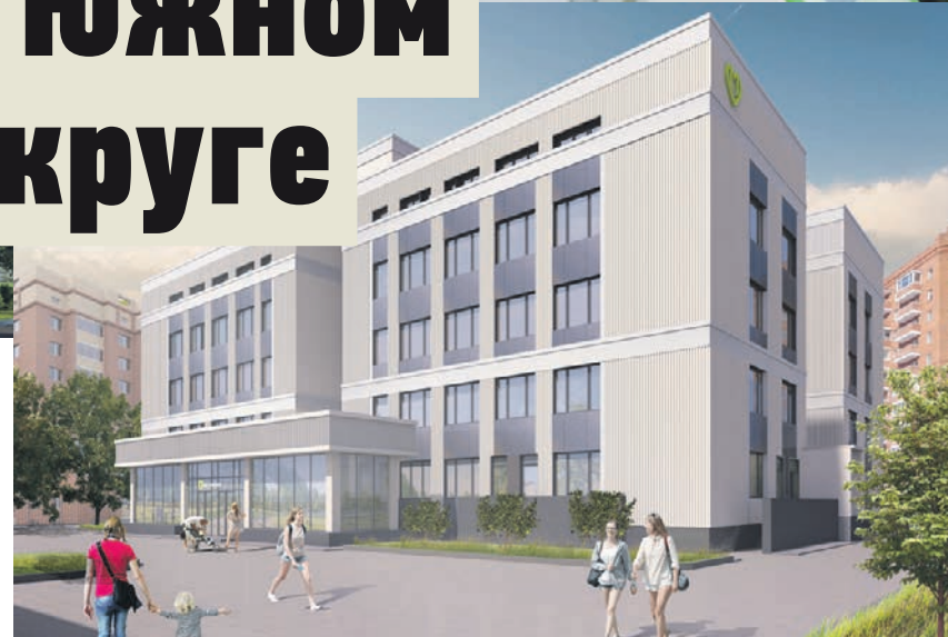
Проект реконструкции городской детской поликлиники № 145 (филиал 1)

ПРЕДСТАВЛЕННЫЕ ПРОЕКТЫ ЯВЛЯЮТСЯ ВИЗУАЛИЗАЦИЕЙ. ОНИ МОГУТ ОТЛИЧАТЬСЯ ОТ РЕАЛИЗОВАННЫХ ПРОЕКТОВ