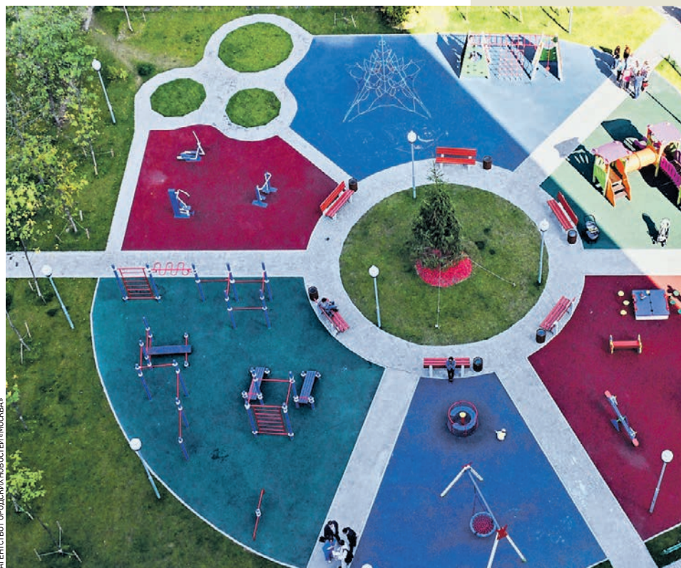
7 сентября 2018 года. Во дворе дома № 17 по Судостроительной улице, возведенного по программе реновации, обустроили спортивные и детские площадки

— К многозальным кинотеатрам добавятся кафе и рестораны, развлекательно-образовательные клубы для детей, спортивные студии, площадки для проведения мастер-классов и других мероприятий, досуговые секции, продуктовый супермаркет и магазины, — рассказал заммэра Москвы Марат Хуснуллин. — Наполнение каждого центра адаптируется под потребности жителей конкретных районов.