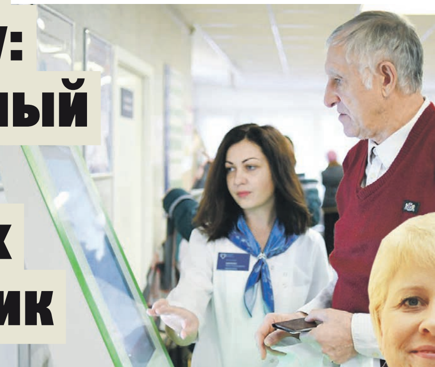
Сотрудница поликлиники помогает пациенту распечатать талон для приема к врачу