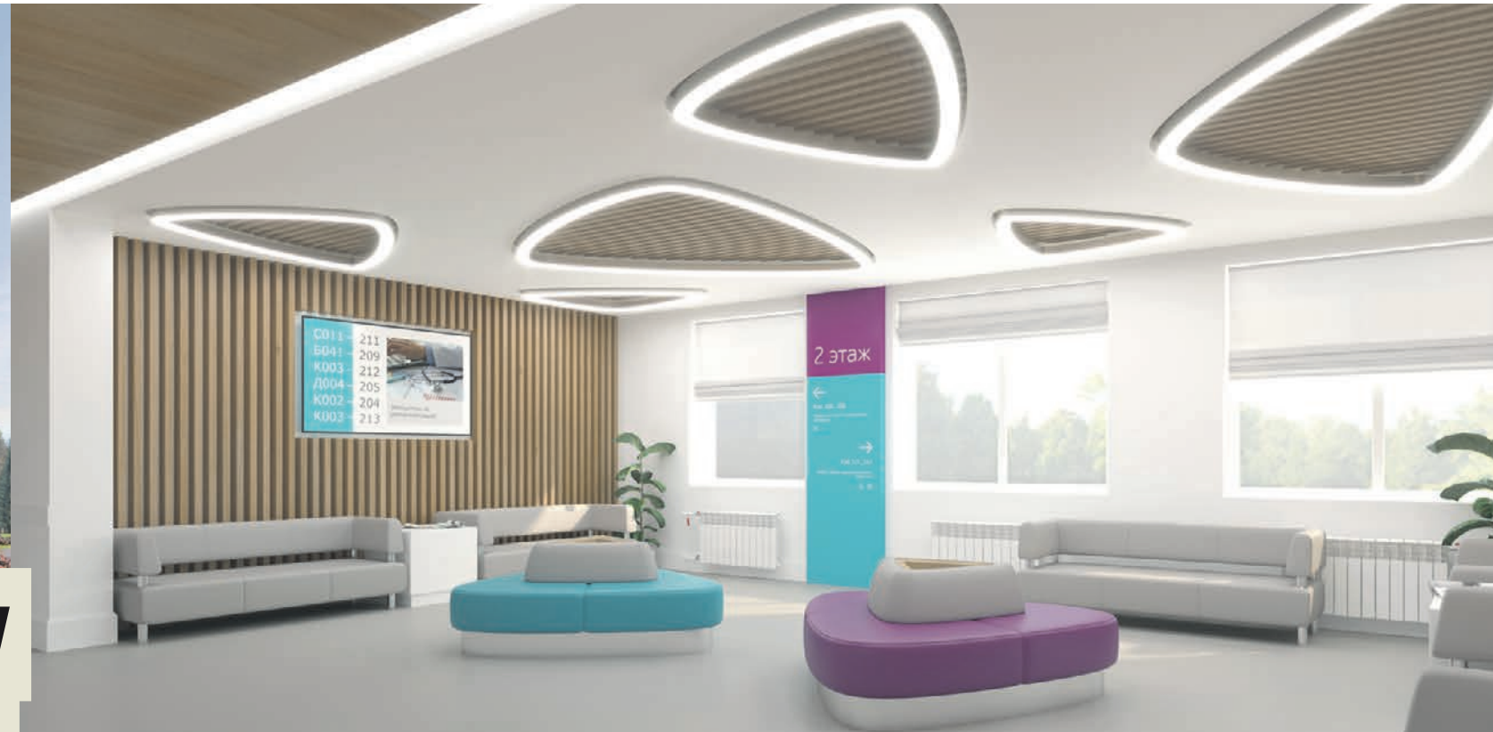
Проект интерьера поликлиники после капитального ремонта. В медучреждениях сделают комфортные зоны ожидания приема и установят электронные табло