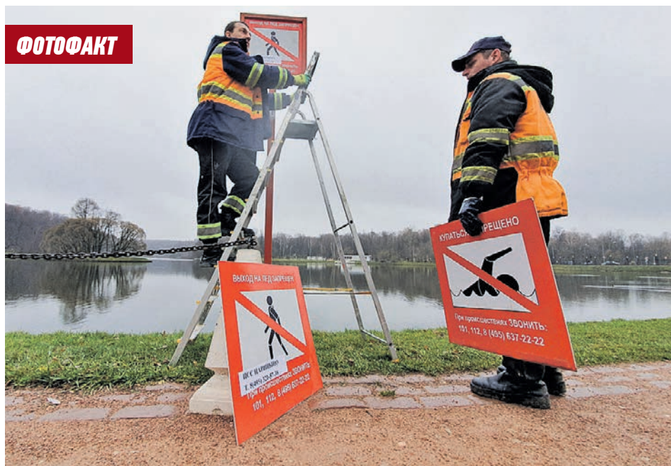
7 ноября 2019 года. Сотрудники Мосводосток заменили 47 предупреждающих знаков у Царицынских прудов. Они сняли таблички «Купаться запрещено» и установили вместо них знаки «Выход на лед запрещен»