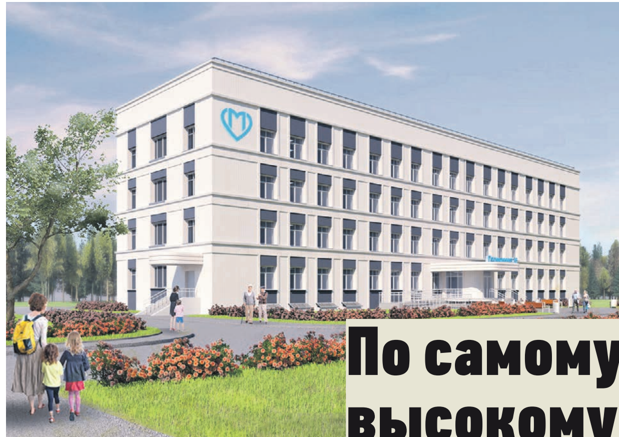
Проект реконструкции городской поликлиники № 2 (филиал 2)

Некоторые здания были построены много десятилетий назад и устарели. Современные потребности современного здравоохранения сейчас совсем не такие, какими были несколько десятилетий назад, когда никто не задумывался об эргономичности и комфорте. В этом году был утвержден «Новый московский стандарт поликлиники», который