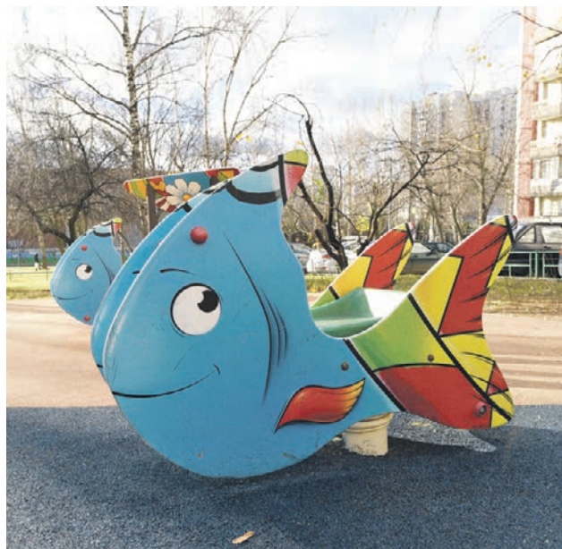
4 ноября 2019 года. На бульваре установили тематические игровые комплексы. Например, качели в форме рыбы

— Для нас, пенсионеров, это очень важно, — рассказала жительница района Тамара Уварова. — Тут рядом продуктовые магазины, аптека, поэтому я ча-