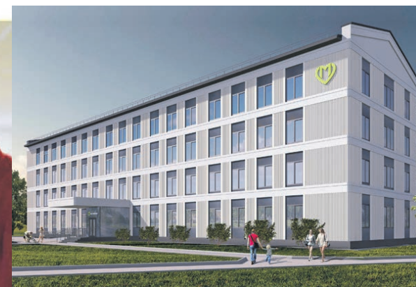
Проект реконструкции поликлиники № 52 (филиал 1)

В каждом филиале будут принимать врачи восьми специальностей, а в головных зданиях дополнительно будут работать специалисты пяти направлений