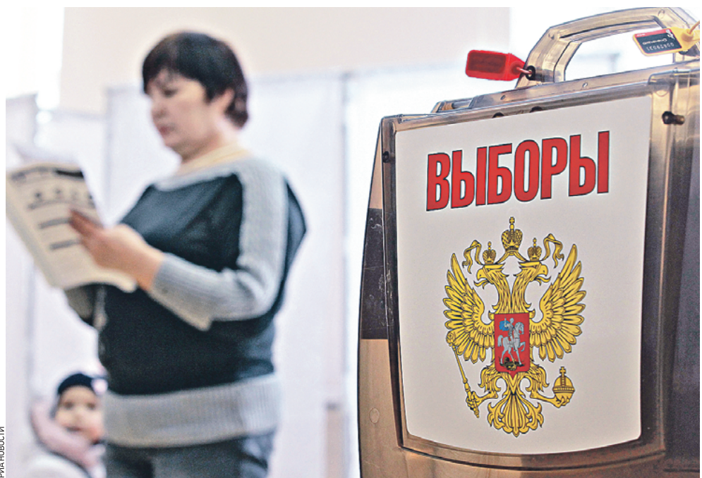
8 сентября москвичей ждут прямые выборы мэра. Процедура его избрания должна быть максимально прозрачной, считают власти города

Сейчас 31 человек подал документы на регистрацию. Предвыборная агитация стартует со дня регистрации кандидата и прекращается в 0.00 за сутки до дня голосования. Согласно Избирательному кодексу Москвы, зарегистрированным кандидатам предоставляется не менее половины общего объема бесплатного эфирного времени для проведения агитации, дебатов. Принять в них участие кандидаты могут только лично. Выбирать мэра будут в единый день голосования, который назначен на 8 сентября этого года. Процесс голосования начнется в восемь утра и закон-