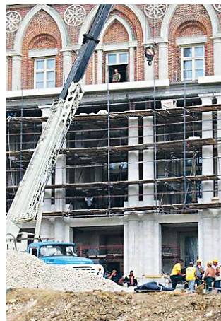
Регулировать строительство должно одно ведомство