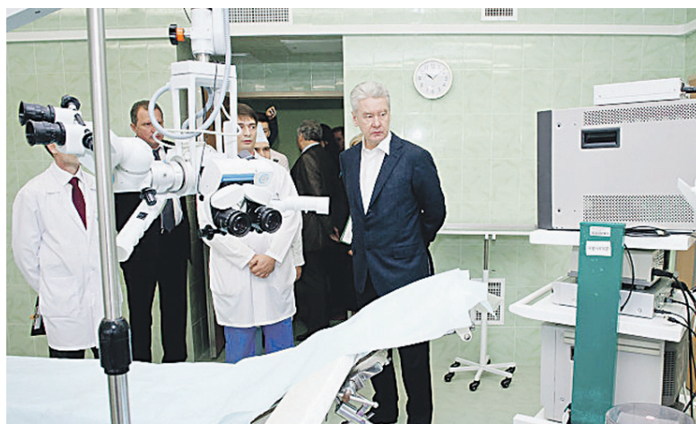
Мэр Москвы Сергей Собянин во время посещения ГКБ №12.

Половину большого и единственного корпуса учреждения занимает хирургическая служба. Хирургия всегда была здесь на высоком уровне, а с вводом новых технологий по программе развития здравоохранения она приобрела совсем иное качество. Больница специализируется на таких направлениях, как микрохирургия глаза, гинекология, травматология, установка протезов коленного, тазобедренного, локтевого, плечевого суставов, нейрохирургия. Здесь проводят операции на головном мозге и