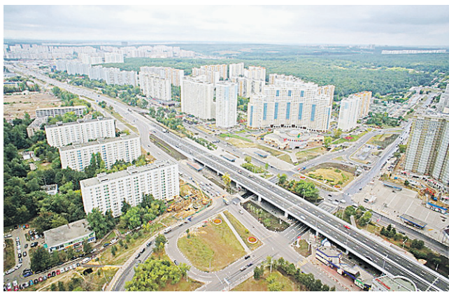
Построенная эстакада на пересечении Варшавского шоссе и улицы Академика Янгеля.