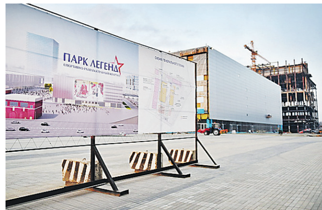
Строительство хоккейного комплекса «Арена Легенд».