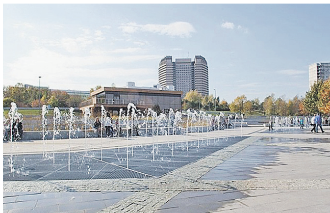
Парк «Садовники» после реконструкции.