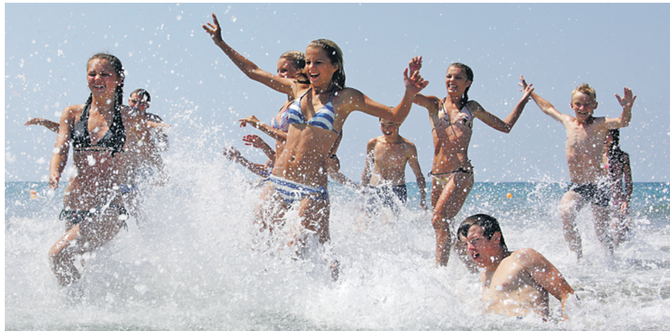
Жаркие июльские дни во Всероссийском детском центре «Орленок» в Краснодарском крае ребята запоминают на всю жизнь

В столице официально стартовала летняя оздоровительная кампания. 17 марта на городском портале государственных услуг были размещены первые льготные путевки. Родителям и детям предложили отдых в коттеджном поселке «Пирин» в Болгарии. Остальные путевки в учреждения отдыха и оздоровления, где летом будут отдыхать московские ребята, будут размещены на портале 25 апреля, опять же ровно в полдень. Для того чтобы получить заветную путевку, необходима в первую очередь регистрация на портале (pgu.mos.ru). После подачи заявления на отдых в течение пяти рабочих дней через личный кабинет родители получат уведомление с просьбой прийти в управу. Это нужно будет сделать только один раз — забрать сертификат на отдых для ребенка. Кстати, в этом году географию детского отдыха расширили. Правительство Москвы организует отдых для детей-льготников