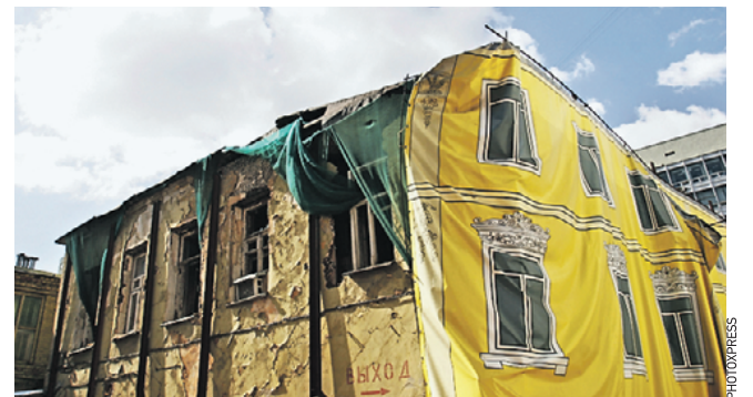
Если в доме никто не живет, это не значит, что про него забыли