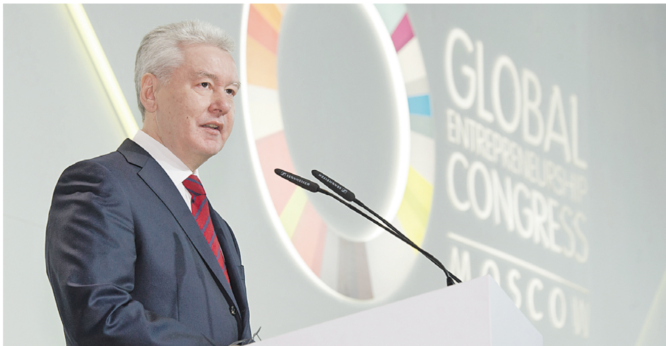
17 марта 10.20 Мэр Москвы Сергей Собянин в приветственной речи участникам Всемирного конгресса предпринимателей подчеркнул: «Москва создала активную и быстрорастущую среду для развития бизнеса и инвестиций»