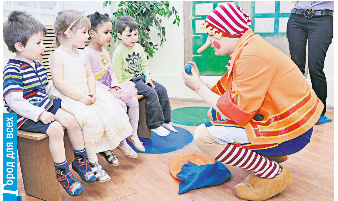
Город для всех