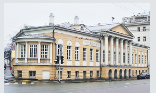
Дом Муравьева-Апостола на Старой Басманной улице в Москве

В столице продолжается реализация проекта реставрации памятников архитектуры силами инвесторов по программе «1 рубль за 1 квадратный метр». В рамках этой программы инвесторы получают в аренду эти объекты за символическую цену при условии их реконструкции. В нынешнем году на аукцион выставят 30 памятников. 12 столичных памятников уже сдано в аренду инвесторам.