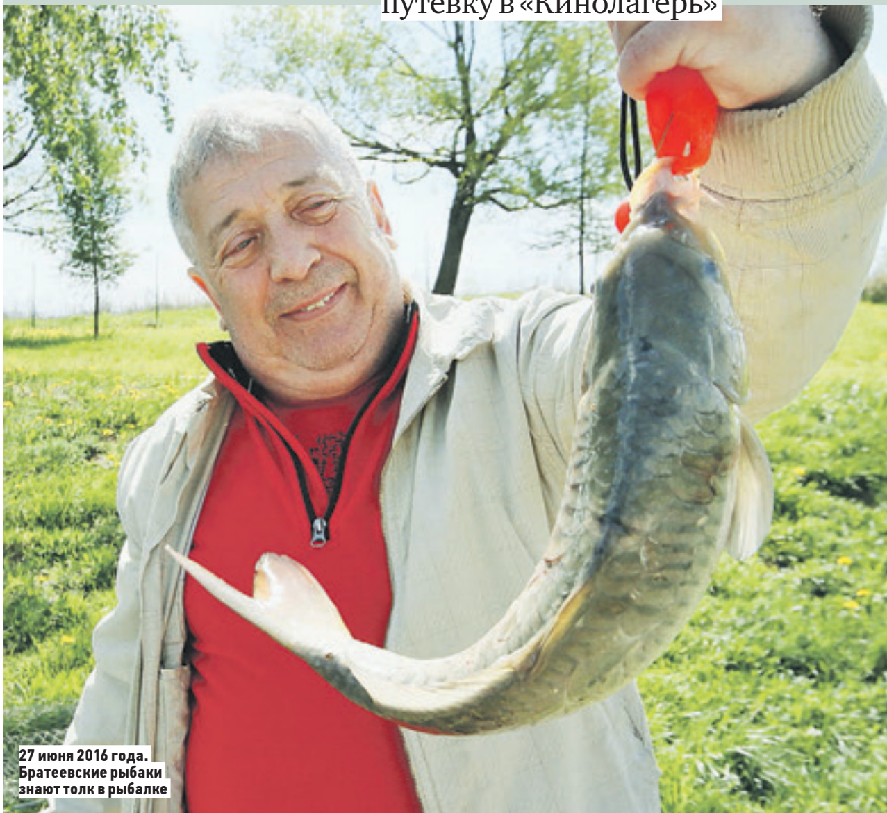
27 июня 2016 года. Братеевские рыбаки знают толк в рыбалке