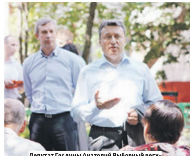
Депутат Госдумы Анатолий Выборный регулярно встречается с жителями округа