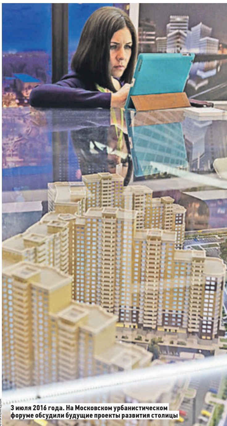
3 июля 2016 года. На Московском урбанистическом форуме обсудили будущие проекты развития столицы

По его словам, с одного посаженного деревца начиналась масштабная акция «Миллион деревьев». С одного благоустроенного сквера стартовала большая программа «Моя улица».