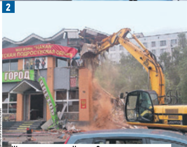
Жительница округа Наташа Смирнова рассказывает, что у этих палаток у станции метро «Коломенское» вечером собираются пьяные компании (1). После первой волны сноса самостроя город заметно преобразился (2)

Еще один объект самостроя в Южном округе, которому недолго осталось существовать, — Нагатинский ры-