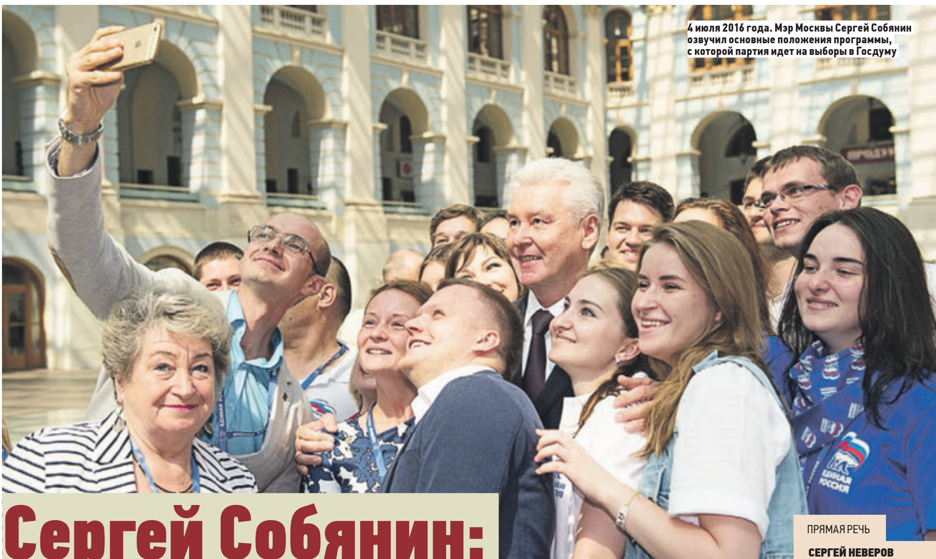
4 июля 2016 года. Мэр Москвы Сергей Собянин озвучил основные положения программы, с которой партия идет на выборы в Госдуму