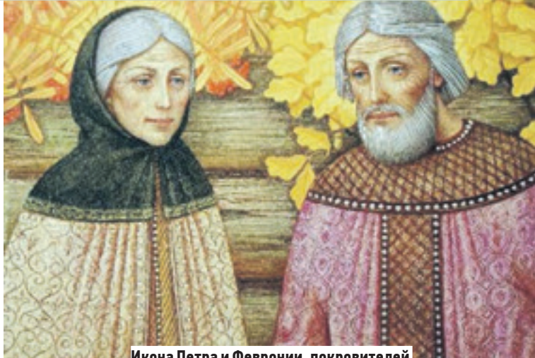
Икона Петра и Февронии, покровителей брака и семейных ценностей

В память о супругах в 2008 году родился праздник Петра и Февронии, он же День семьи, любви