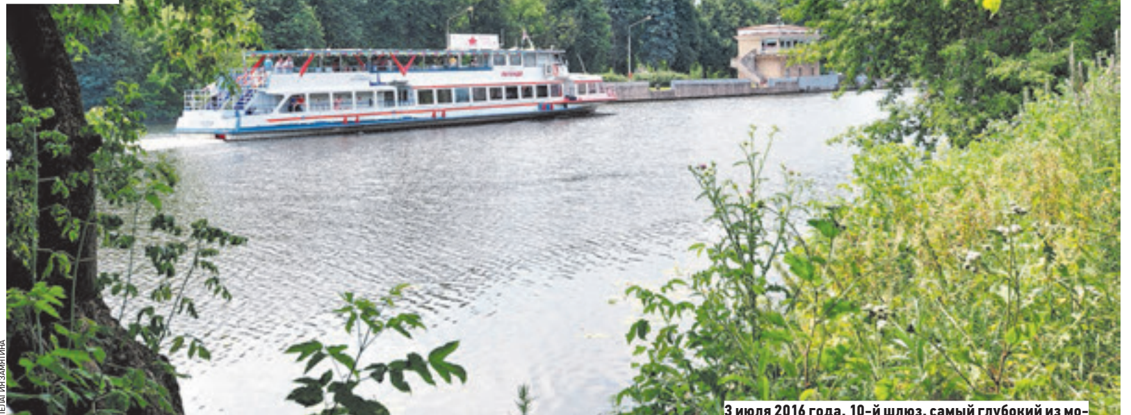
3 июля 2016 года. 10-й шлюз, самый глубокий из московских шлюзов. Пропускает суда из верхнего течения Москвы-реки в нижнее и обратно

Необходимость подачи воды в мелеющую летом Москве-реку возникла уже в конце 1920-х годов: стремительно растущему городу вскоре было бы нечего пить. В 1931 году было решено проложить канал протяженностью 128 километров: он