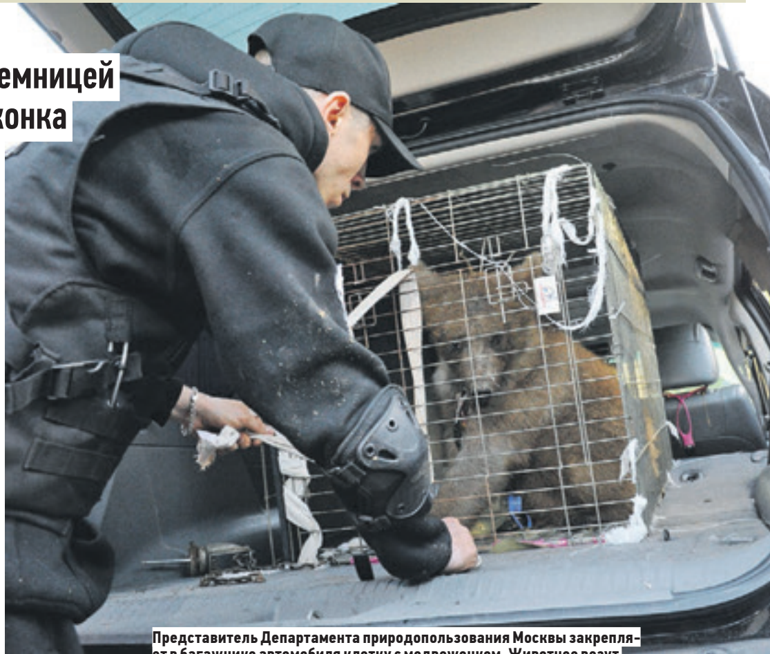
Представитель Департамента природопользования Москвы закрепляет в багажнике автомобиля клетку с медвежонком. Животное везут в московский приют для животных «Бим»