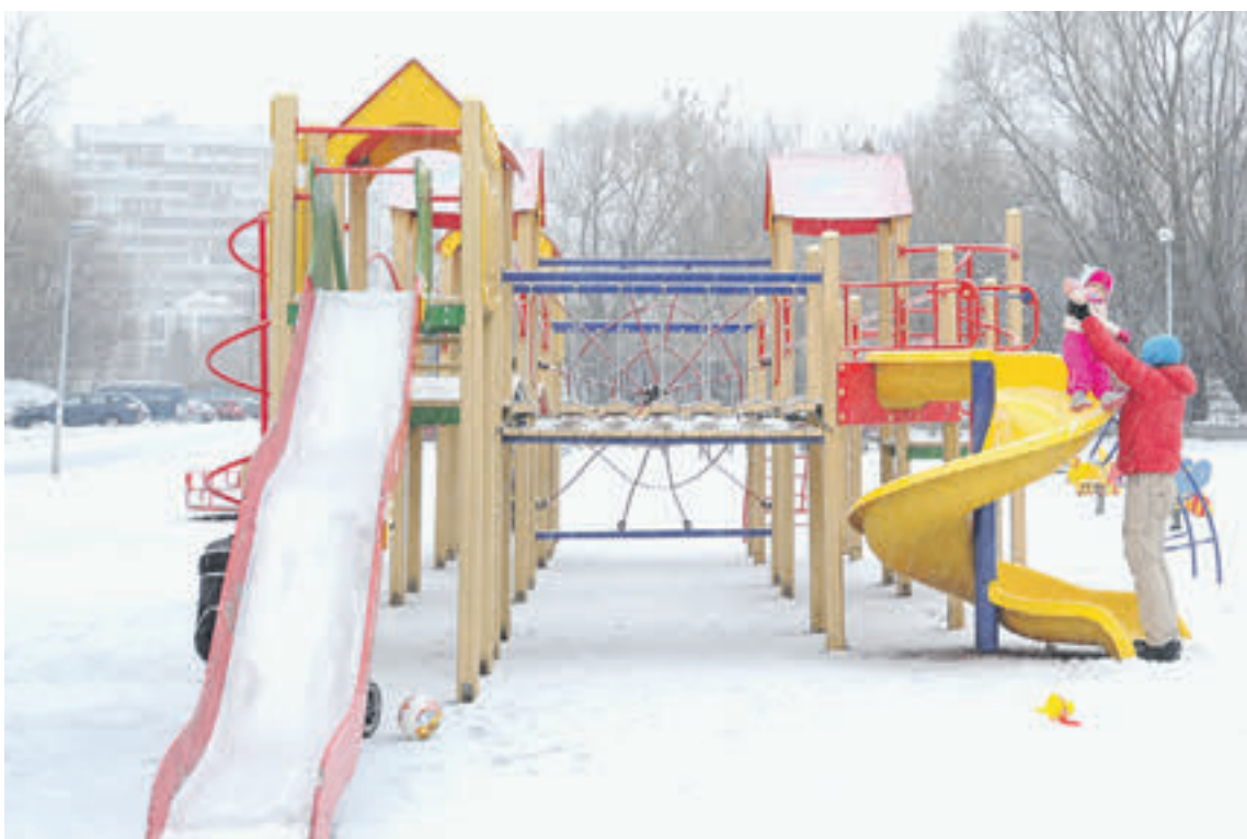
26 ноября 2016 года. Площадка возле дома 12, корп. 1–3 по улице Кошкина (1) — одна из многих, благоустроенных на средства от платных парковок. Аня Чаркина довольна новой детской площадкой (2)