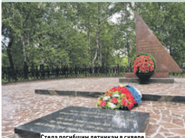
Стела погибшим летчикам в сквере «Школьный» на Медынской улице

Акция «Вахта памяти» пройдет 5 декабря в сквере «Школьный» на Медынской улице, у стелы погибшим летчикам. Мероприятие приурочено к годовщине битвы за Москву. В нем примут участие представители управы и ветеранских организаций, школьники и активные жители района.