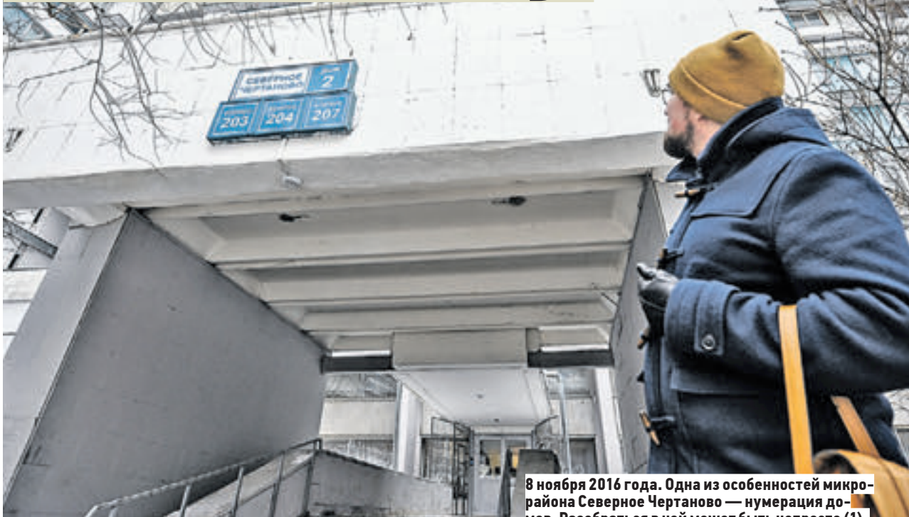
8 ноября 2016 года. Одна из особенностей микрорайона Северное Чертаново — нумерация домов. Разобраться в ней может быть непросто (1). Макет жилого комплекса (2)