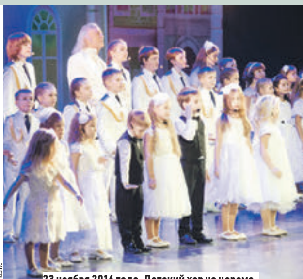
23 ноября 2016 года. Детский хор на церемонии вручения премии «Крылья аиста»

В 26 московских технопарках уже создано более 32 тысяч рабочих мест. И это направление продолжает развиваться.