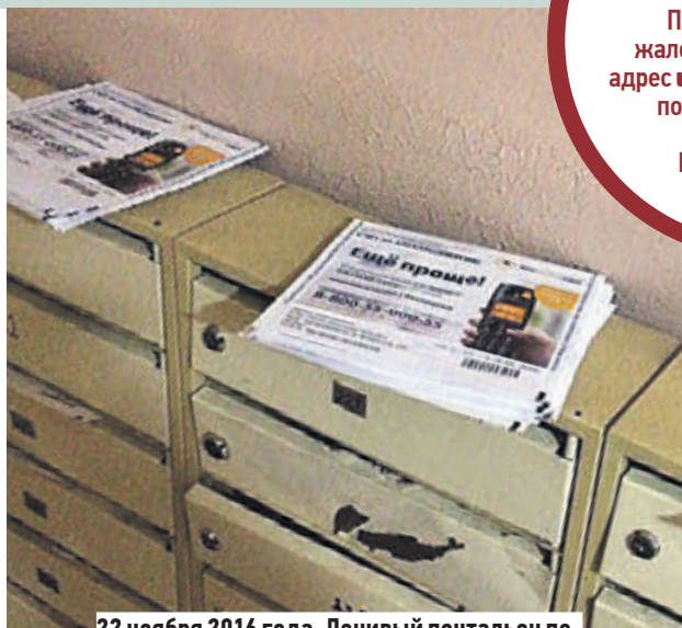
22 ноября 2016 года. Ленивый почтальон перестал раскладывать квитанции по ящикам

В настоящее время по факту инцидента с доставкой квитанций на Чертановской улице уже начата служебная