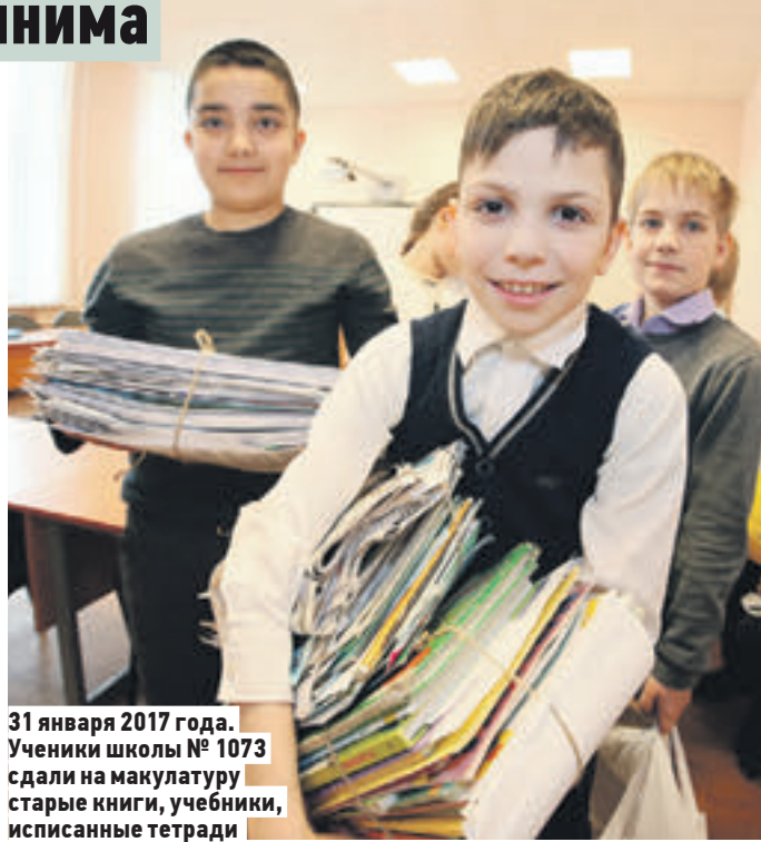
31 января 2017 года. Ученики школы № 1073 сдали на макулатуру старые книги, учебники, исписанные тетради