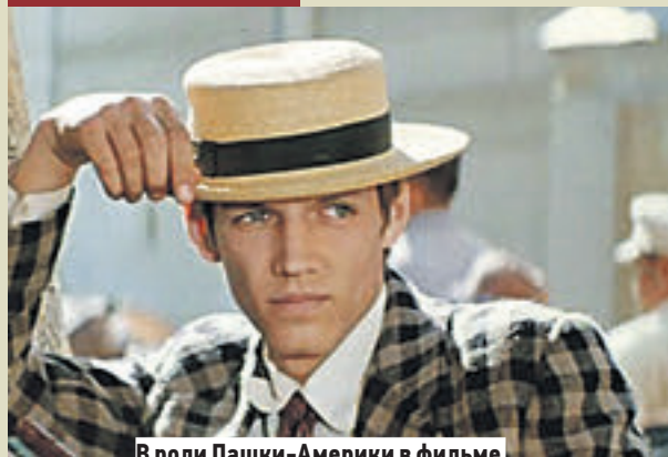
В роли Пашки-Америки в фильме «Трактир на Пятницкой» (1978)