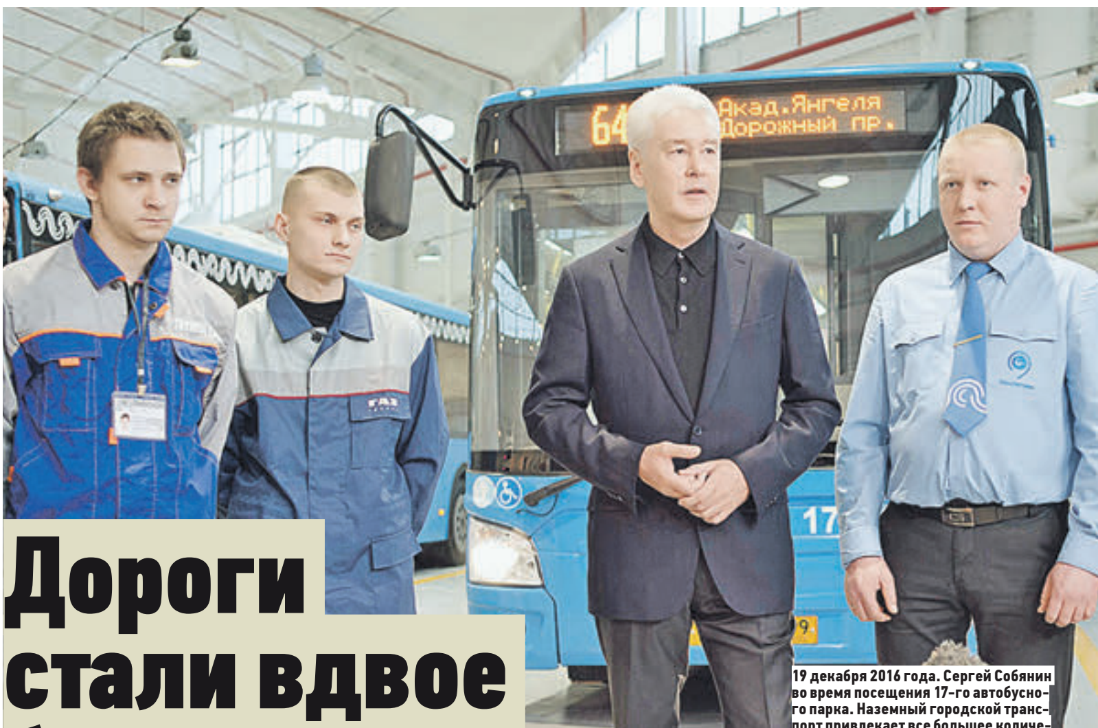
19 декабря 2016 года. Сергей Собянин во время посещения 17-го автобусного парка. Наземный городской транспорт привлекает все большее количество пассажиров

факторов, улучшающих дорожное движение в городе, развитие системы каршеринга — аренды легковых авто.