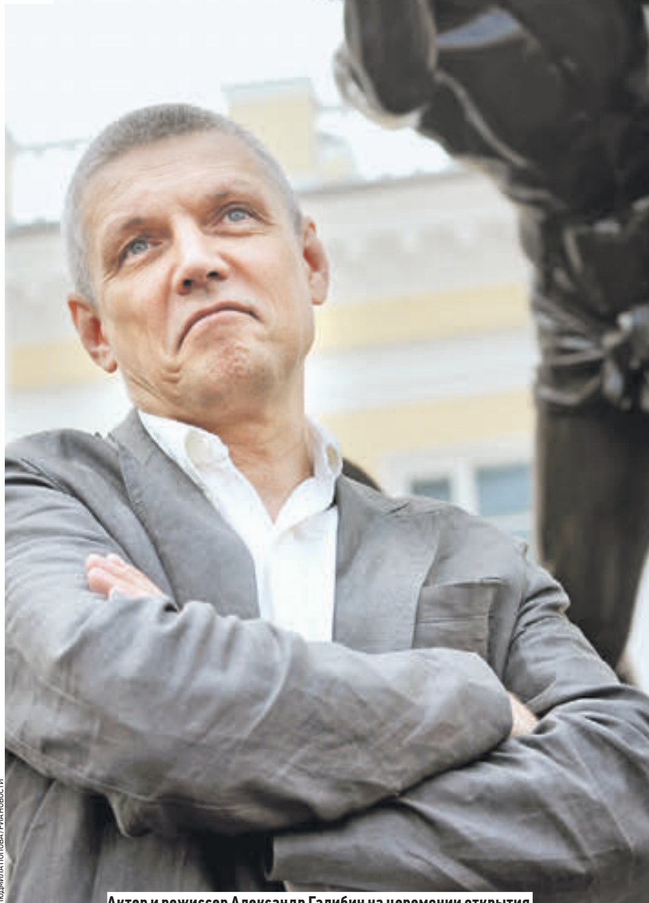
Актер и режиссер Александр Галибин на церемонии открытия трех залов Александровского дворца после реставрации

Беседовала АНЖЕЛИКА ЗАОЗЕРСКАЯ okrug@vm.ru