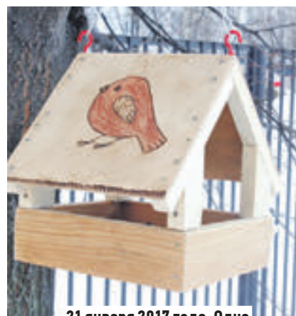
21 января 2017 года. Одна из кормушек, сделанных учениками лицея