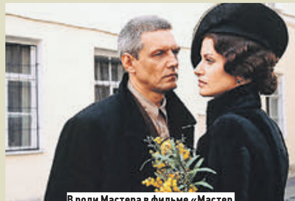
В роли Мастера в фильме «Мастер и Маргарита» (2005)