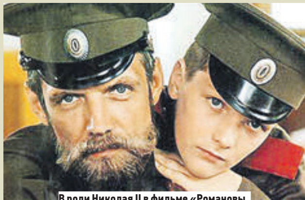
В роли Николая II в фильме «Романовы. Венценосная семья» (2000)