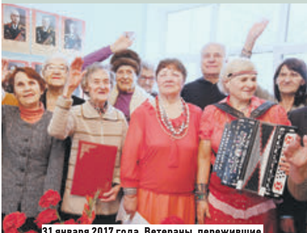
31 января 2017 года. Ветераны, пережившие блокаду, на встрече в ЦСО «Орехово»

31 января в центре социального обслуживания «Орехово» (филиал «Братеево») чествовали ветеранов, переживших блокаду Ленинграда. 125 граммов хлеба в сутки, караваны полуторок по Дороге жизни — 872 невозможных дня блокады. Не сдались, выстояли всем смертям назло.