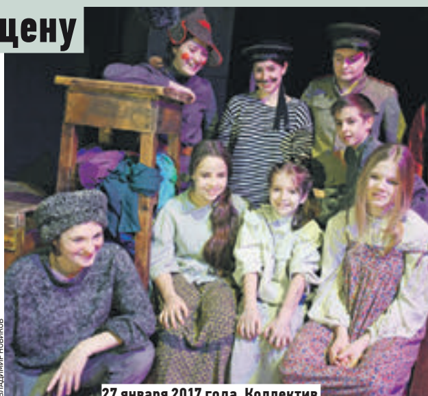
27 января 2017 года. Коллектив «Театра на набережной»

Сергей Собянин открыл движение по автодорожному путепроводу на 34-м километре Курского направления железной дороги.