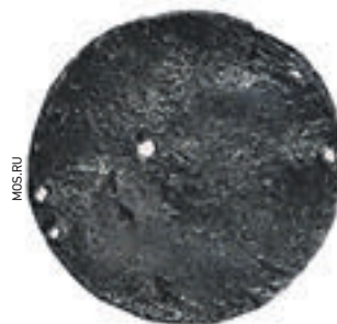
Судя по четырем отверстиям по краям, медальон использовался в качестве нашивки на одежду

Количество преступлений, зарегистрированных в Москве за 2016 год, сократилось почти на 11 процентов.