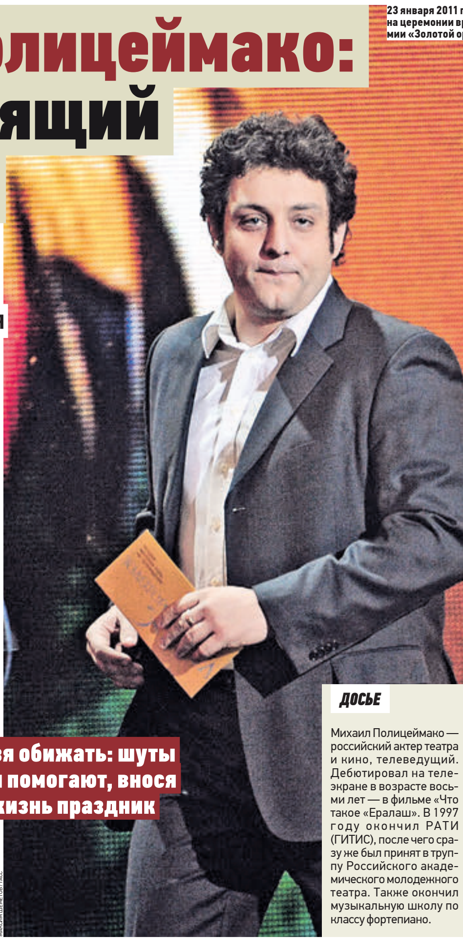
23 января 2011 года. Актер Михаил Полицеймако на церемонии вручения национальной кинопремии «Золотой орел» на «Мосфильме»

учит детей. После занятий я сам ехал домой на метро, ничего не боялся. Мое детство было беззаботным. Задатки артиста стали проявляться уже в средней школе, за что наша классная руководительница меня