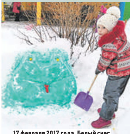
17 февраля 2017 года. Белый снег превращается... в зеленую лягушку

Лягушки и осьминожки, сороконожки и киты появились на территории дошкольного отделения «Радуга» образовательного комплекса ГБУ Школа № 2001. Все они сделаны из снега воспитанниками детского сада и их воспитателями.