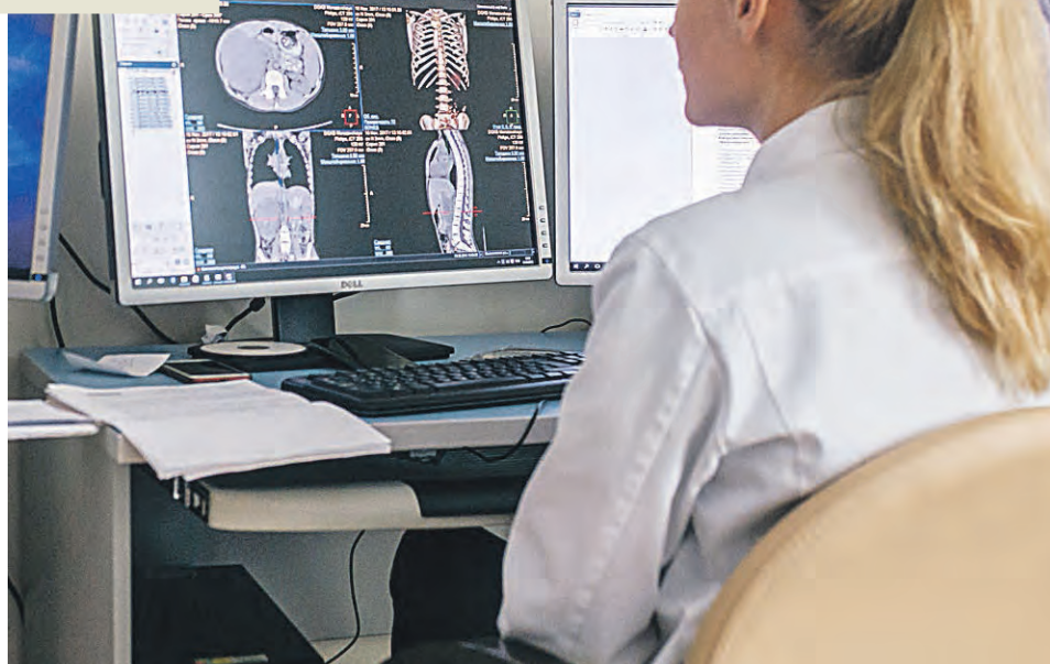
1 июня 2018 года. Президент России Владимир Путин, заместитель председателя правительства России Татьяна Голикова, министр здравоохранения России Вероника Скворцова и мэр Москвы Сергей Собянин (справа налево) посетили Морозовскую детскую городскую клиническую больницу (1). Благодаря современному оборудованию даже самый сложный диагноз врачи ставят быстро (2)

На семи этажах нового корпуса, открывшегося в октябре прошлого года, — отделения всех профилей: от экстренной сердечно-сосу-