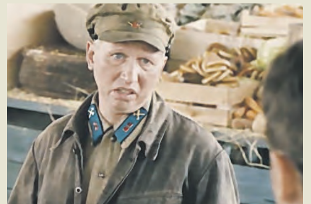
В фильме «Чкалов» (2012) актер сыграл роль авиамеханика Никодимыча