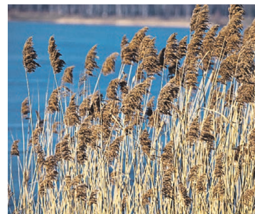
ТРОСТНИК — его часто путают с камышом. Распространенное злаковое растение из семейства осоковых.