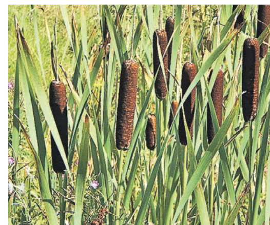
РОГОЗ — болотная трава, стебель которой заканчивается соцветием из бурых мужских цветков.