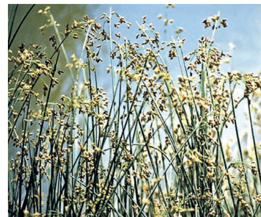
КАМЫШ — стебель цилиндрический высотой до 3,5 метра. Цветки в колосках собраны в зонтиковидное соцветие.

ПРЕДСТАВЛЕННАЯ ГРАФИКА ЯВЛЯЕТСЯ ВИЗУАЛИЗАЦИЕЙ, КОТОРАЯ МОЖЕТ ОТЛИЧАТЬСЯ ОТ РЕАЛИЗОВАННОГО ПРОЕКТА