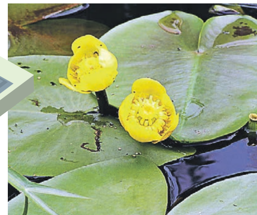
ЖЕЛТЫЕ КУБЫШКИ — в простонародии кувшинка. Многолетний цветок, который растет на водоеме.