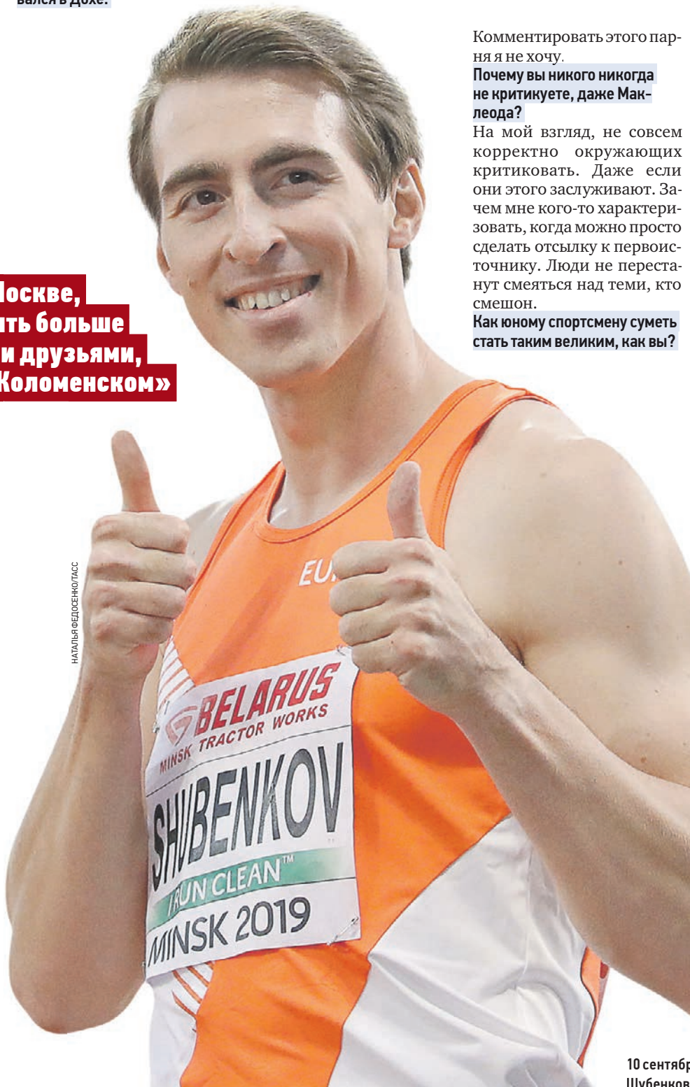
10 сентября 2019 года. Легкоатлет Сергей Шубенков на соревнованиях в Минске