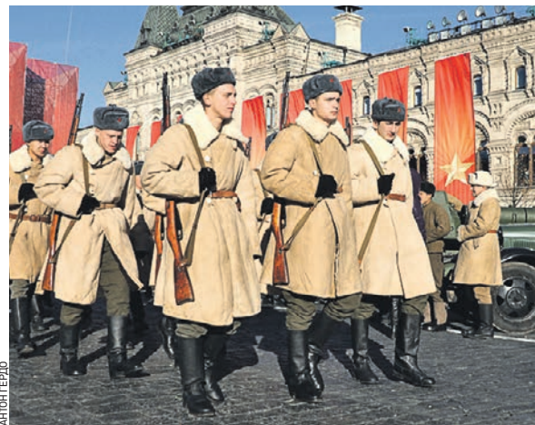
7 ноября 2018 года. Реконструкция парада 1941 года на Красной площади. Военные в форме пехотинцев того времени

Свыше миллиона квадратных метров жилья введено в эксплуатацию в Новой Москве с января по октябрь 2019 года.