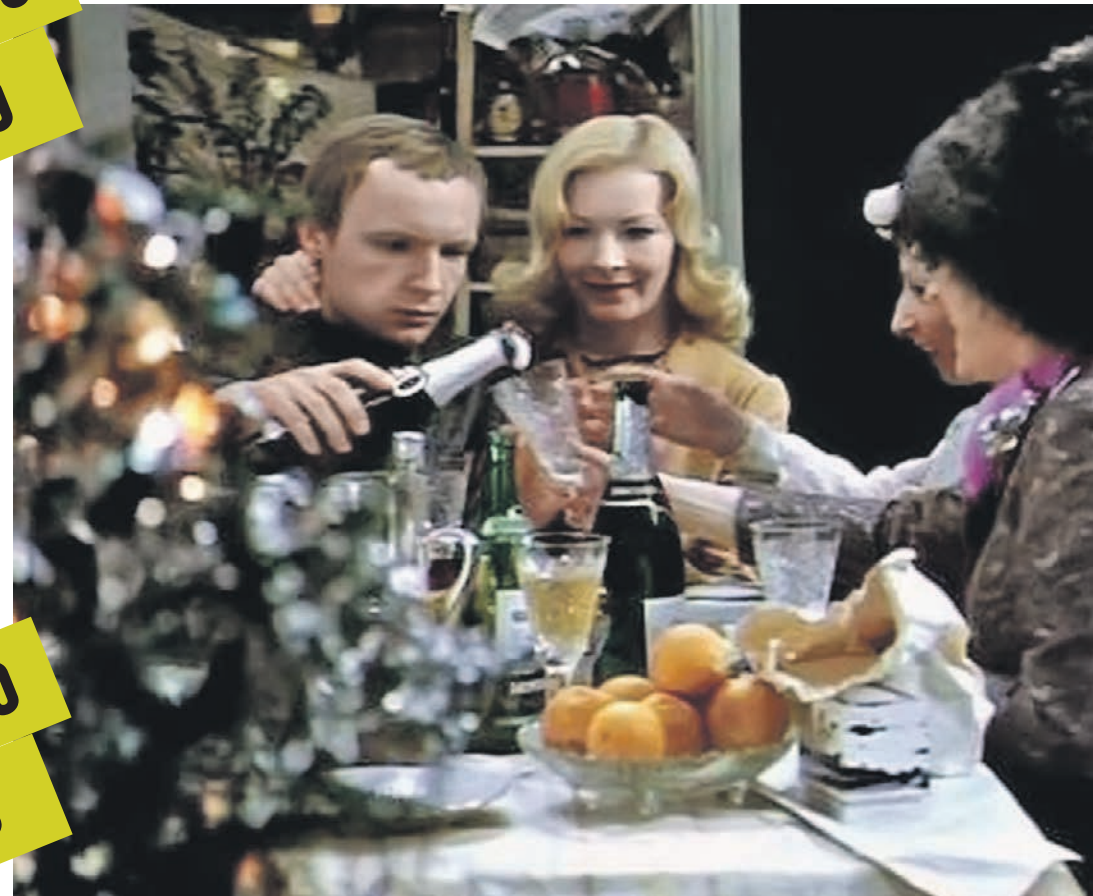
Кадр из фильма «Ирония судьбы, или С легким паром!» (1975). Главные роли исполнили актеры Андрей Мягков и Барбара Брыльска. Фразы с новогоднего застолья разошлись среди россиян на цитаты

Лучший это новогодний фильм или нет — копий на эту тему сломано немало. Но факт остается фактом! Ни один Новый год без «Иронии судьбы» не обходится. Трагические, комические и добрые приключения Жени Лукашина не оставляют равнодушным никого. Один досадный случай изменил судьбу сразу трех человек. Впрочем... Зачем пересказывать всем известный сюжет. Интереснее другое: а что ели герои любимого фильма и можно ли повторить их меню сегодня. А если и не повторить, то переделать так, чтобы символ следующего года — Белая Металлическая Крыса — осталась довольна. Наш корреспондент приготовил и съел (не дожидаясь новогодней ночи), а предварительно сфотографировал старые блюда на новый мотив.