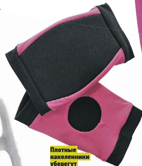
Плотные наколенники уберегут от мелких травм