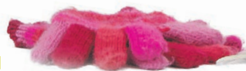
Перчатки спасут не только от холода, но и от ссадин