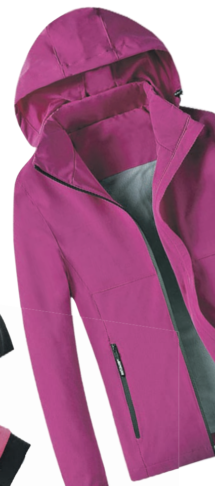
Ветровка. Лучше из яркой, заметной ткани

Для группировки при падении нагните голову вперед, прижмите подбородок к груди. Разверните в падении корпус так, чтобы удар пришелся на бедро и голень. Потренируйтесь падать дома на диване!