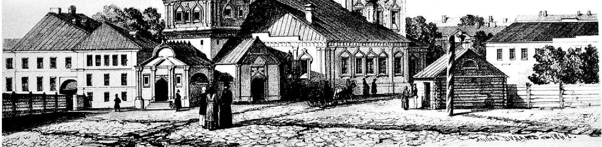
Зарисовка Андре Дюрана. 6 октября 1839 года. На изображении — храм Николая Чудотворца в Хамовниках