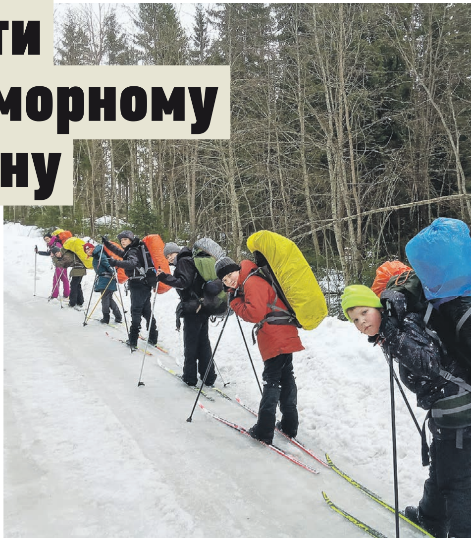
Февраль 2020 года. Ученики школы № 904 во время туристического похода по Карелии

В лыжный поход клуб отправился в рамках второго этапа 75-го столичного первенства по туризму. — Мы два года подряд занимали первые места и на-