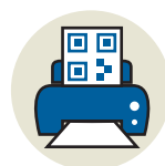
Пропуск необходимо распечатать

Для жителей столицы старше 65 лет обеспечена доставка на дом лекарственных препаратов, которые положены по рецепту бесплатно либо по льготным ценам, а также медицинских изделий (положенных по рецепту бесплатно). В случае необходимости доставки продуктов, лекарств и решения других бытовых проблем пожилые и хронически больные москвичи могут звонить по номеру телефона +7 (495) 870-45-09 . На помощь им придут социальные работники и волонтеры. По этому же номеру телефона можно заказать доставку на дом бесплатных и льготных лекарств и медицинских изделий.