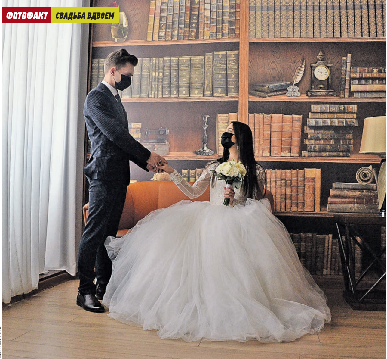
ФОТОФАКТ СВАДЬБА ВДВОЕМ

Нечто нелепое и несуразное выпало из нашей жизни так неожиданно и просто, что пока ощущаешь только пустоту. Но и странную легкость. Стало ясно, например, без общения с кем реально тоскуешь, кого не хватает, кому звонишь, чтобы поболтать ни о чем. Наш мир, так давно и плотно ушедший в виртуальность, столкнулся с реальностью, как «Титаник» с айсбергом. Оказалось, что без настоящего очень трудно дышится. Виртуальность осталась — вот тебе экскурсии и даже путешествия, вот посещение вернисажей и просмотр фильмов и сериалов. И это здорово — такая возможность, во многих случаях уникальная, но... Но хочется настоящего! Шума галерей и гула улиц, оживленных парков и кафешек. Той жизни со вкусом, цветом и ароматом, которая иногда так надоедала и которую мы так бездарно разменивали на ту самую виртуальность, тратя время на сидение в соцсетях или играх. Сейчас бы поболтать с друзьями не по скайпу, увидиться не по сеансу видеосвязи, а посидеть за столиком, глядя друг другу в глаза. Все это вернется! Обязательно. Важно не растерять, сохранить в памяти это сегодняшнее ощущение потери, обнажившее настоящее, сберечь в себе память об этой неожиданной пустоте — тем трепетнее будет отношение к тому, что ее заполнит, вернувшись. И очень хочется пожелать тем, кто играет сейчас свадьбы вдвоем, чтобы спустя много лет они любили друг друга так же, как сегодня, и боялись лишь одного — потерять друг друга.