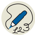
или записать номер