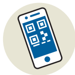
или сохранить в смартфоне