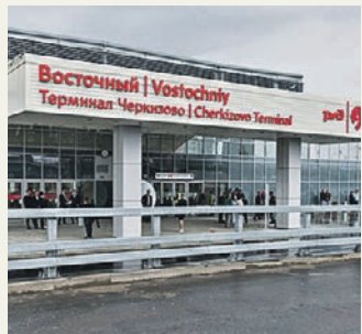
29 мая 2021 года. Новый вокзал для поездов дальнего следования «Восточный» открылся в Москве

■ Детские технопарки запускают новые программы. В проекте «Активный гражданин» москвичи выбрали новые программы для детских технопарков. Более половины из двухсот тысяч проголосовавших решили, что ребятам стоит обучать экологии и заинтересовывать «зеленой экономикой».