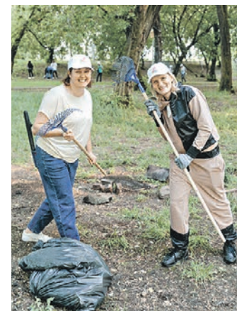
27 мая 2021 года. Участники «Эко-БУНТа» в народном парке Нагатинского Затона