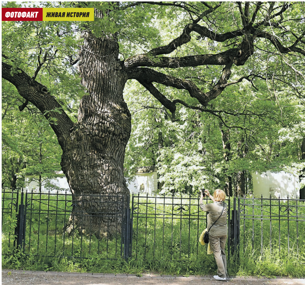
13 июня 2021 года. Настоящий памятник природы и истории — «Петровский» дуб-великан в Коломенском, в Нагатине-Садовниках, — встречает первое лето своего шестого века жизни. По преданию, здесь, под сенью ветвей, обучался грамоте будущий царь Петр I

Мы очень долго не знали, что с ними делать — слишком самостоятельными, амбициозными, а порой замкнутыми и ленивыми. Лед тронулся, когда о проблемах молодых заговорили в высших эшелонах власти, а российский президент поручил включить поддержку молодежи в каждый нацпроект. И вдруг оказалось, что нерешенных вопросов — тьма. Почти две трети молодых людей сегодня говорят, что им очень трудно добиться успеха в жизни. А 90 процентов россиян ждут от них реальных дел во благо страны и общества. Что, впрочем, не мешает большинству считать инфантильность главной чертой современной молодежи. По закону к ней с этого года относятся российские граждане в возрасте от 14 до 35 лет. Период длинной в двадцать лет. Подростки испытывают терпение взрослых, выбирая из множества вариантов свое призвание. Не все получается сразу. Особенно если учесть гиперопеку родителей, бьющих крылом над недорослями. Как тут стать самостоятельным? Но каким-то чудом к двадцати годам дети наши бросаются на помощь нуждающимся, берутся за голову и начинают удивлять неожиданными открытиями и изобретениями. И число молодых руководителей крупных компаний тоже растет год от года. Можно продолжать ворчать на их излишнее увлечение интернетом или увидеть в этом потенциал и помочь каждому молодому человеку, встающему на ноги, просто поверить в свои силы. Им, молодым, от нас в первую очередь нужно именно это.