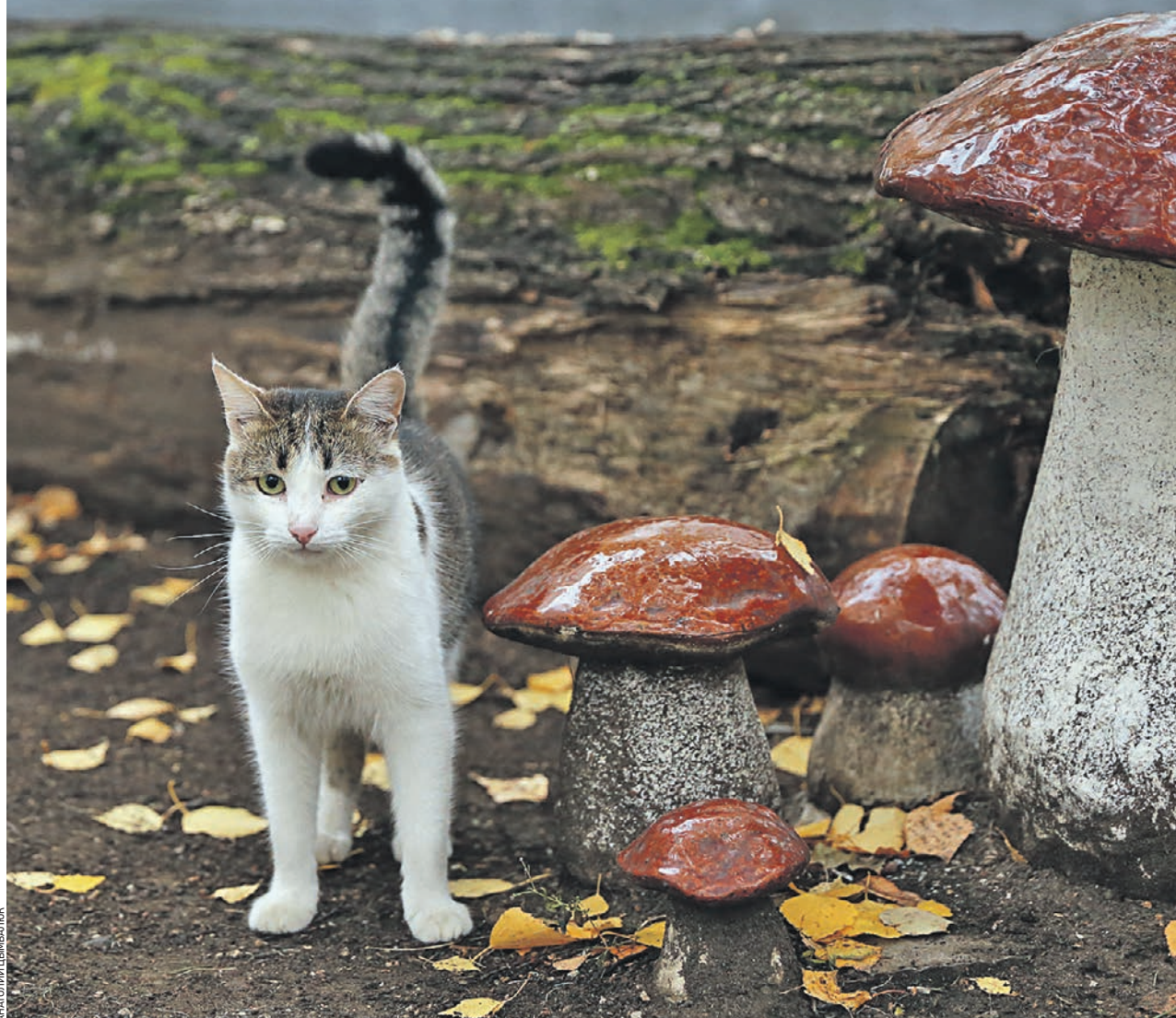
14 октября 2021 года. Возле галереи «На Каширке» выросли подосиновники... но, постойте, похоже, эти грибы — рукотворные! Выглядят арт-объекты как настоящие — вот и вышедшая погулять кошка замерла в недоумении: на вид гриб, но пахнет иначе... Что-то тут не так!