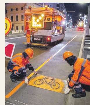
17 октября 2021 года. Сотрудники дорожных служб наносят разметку по трафарету для велодорожки

■ Готовим фигуристов и гимнастов. На территории бывшего Тушинского аэродрома появился спорткомплекс «Чкалов Арена». Здесь можно будет заниматься плаванием, фехтованием, гимнастикой, фигурным катанием, хоккеем и другими видами спорта.