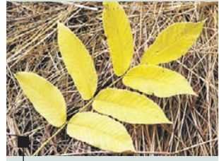
Орех маньчжурский становится золотистым