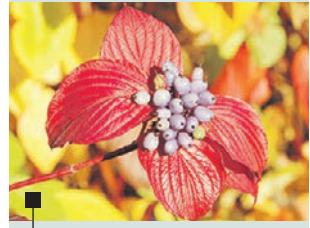
Дерен белый по осени радует ярким пурпуром