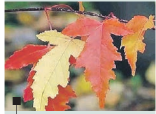
Листья клена Гиннала чуть более светлые, чем у дёрена