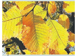
Листья вяза гладкого становятся желто-рыжими

ПУТЕВОДИТЕЛЬ ПО ЛИСТОПАДУ Занимательный путеводитель по осенним листьям подготовили специалисты музея-заповедника «Коломенское». А мы предлагаем вам посмотреть на самые необычные окрасы деревьев, которые можно встретить на улицах и в скверах Южного округа!