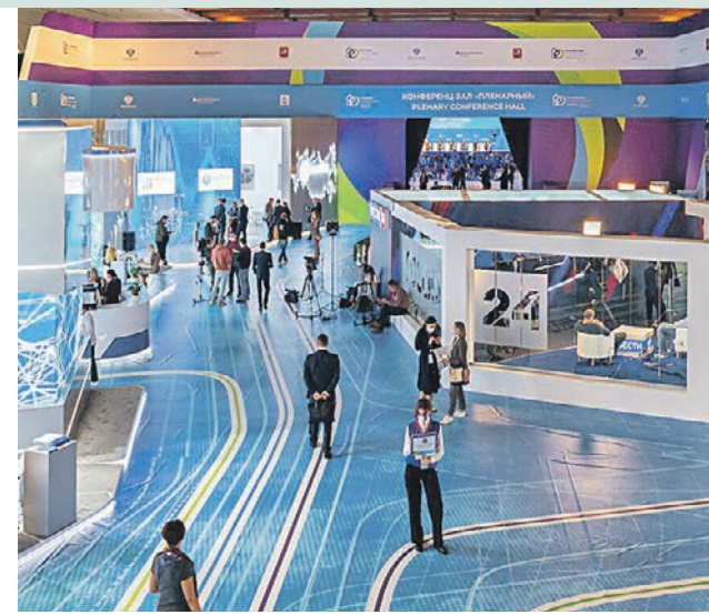
14 октября 2021 года. На международном форуме «Российская энергетическая неделя» столица представила свои разработки