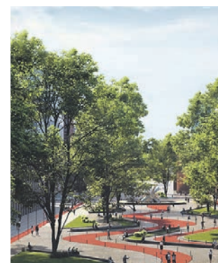
Проект бульвара братьев Весниных. Бульвар появится в Даниловском районе

Инновации сейчас не просто в моде, они востребованы во всех отраслях. Простое доказательство: выпускаемая в столице продукция стала на треть востребованнее в этом году по сравнению с 2020-м. На 32 процента выросли показатели неэнергетического экспорта — до 17,5 миллиарда долларов. Москва экспортирует более чем в 180 стран мира.