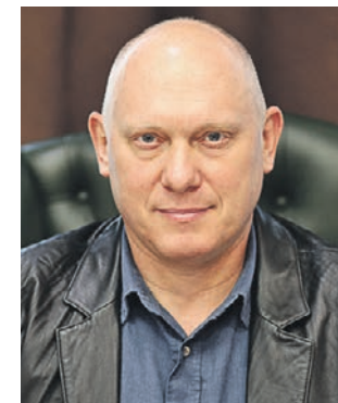
2 ноября 2021 года. Депутат Московской городской думы, космонавт-испытатель Олег Артемьев