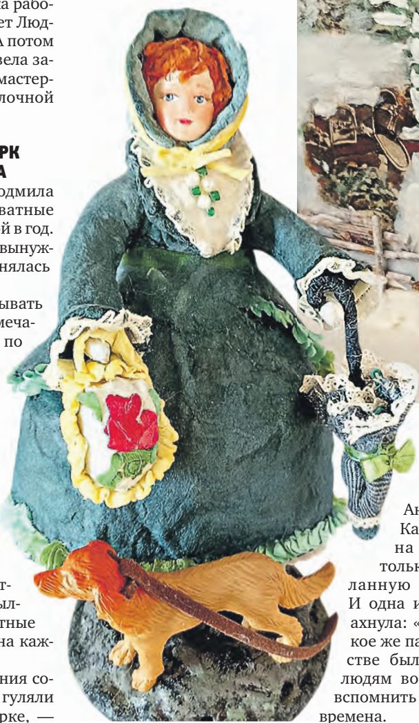
Интерьерная кукла «Дама с собачкой» высотой около 15 сантиметров