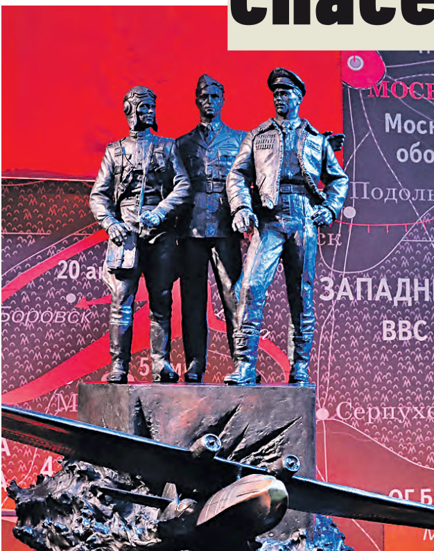
Скульптура в залах «Дороги Памяти», посвященная советским военным летчикам

скове, но она захлебнулась. Потери со стороны вермахта были колоссальны, поэтому командование медлило отдавать приказ о продолжении атак. Благодаря этому Красная армия переломила ситуацию и перешла в контрнаступление.