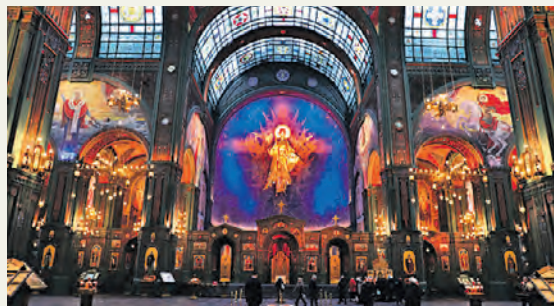
Зал главного храма Вооруженных сил России

Строительство главного храма Вооруженных сил России — патриаршего собора во имя Воскресения Христова — завершилось 9 мая 2020 года, в день 75-летней годовщины Великой Победы. Значимые даты и цифры скрыты в самих пропорциях храма: например, диаметр башни главного купола храма составляет 19,45 метра, а высота малого купола — 14,18 метра. Храм возвели на благотворительные пожертвования: всего в финансировании строительства приняли участие более 94 тысяч человек. Главной иконой храма стал Спас Нерукотворный — этот уникальный образ написали на деревянных досках орудийного лафета пушки 1710 года.