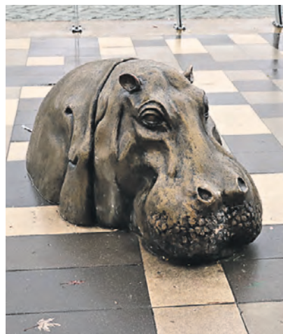
Скульптура гиппопотама на набережной

сказала, что стала приезжать сюда специально, чтобы погулять у реки.