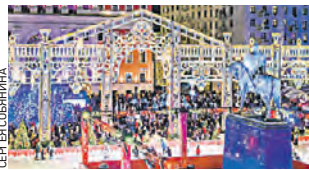
Сервис Russpass поможет подобрать самые красочные места

— Специальный раздел поможет быть в курсе событий и распланировать время в зимние праздники, — сообщил в социальных сетях мэр Сергей Собянин.