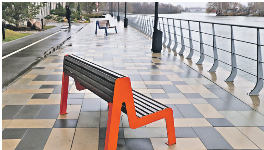
На набережной установили удобные эргономичные лавочки для горожан