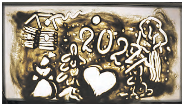
Этот рисунок создали специально для «ЮГ» накануне Нового года

и на душе светло становится. Песочную анимацию иногда называют одним из видов медитации, когда человек погружается в себя, свои эмоции, проживает их и находит решение для любой проблемы.