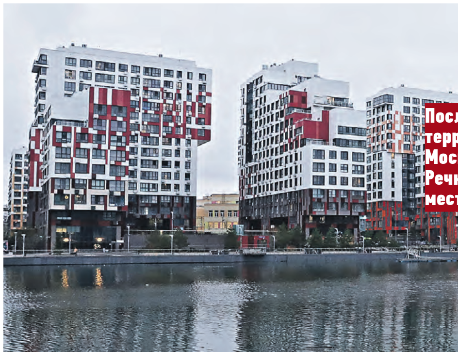
Благоустроенная территория 6-го квартала района Нагатинский Затон