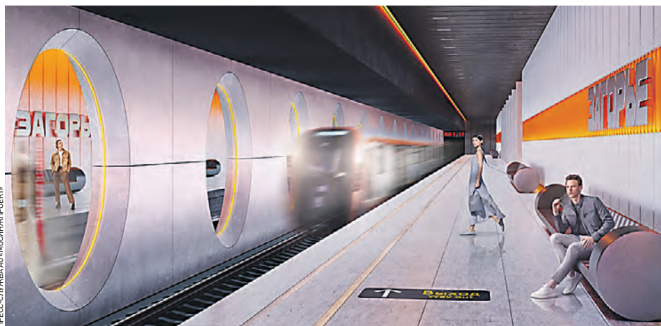
Проект станции «Лебедянская» Бирюлевской линии метро. Изначально она называлась «Загорье»

живают примерно 1,5 миллиона человек, а еще несколько сотен тысяч здесь работают или учатся. Общая длина линии составит около 40 километров. Она станет самой протяженной за пределами Московской