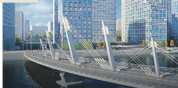
Проект велопешеходного моста в Нагатинском Затоне. С его помощью жители района смогут быстрее попадать к БКЛ

Необычной станет и форма самого искусственного сооружения — ее сделают в виде полумесяца. Так, верхняя балка будет опираться на вертикальные мачты, подвешенные на тяжелых стержнях. В центральном пространстве создадут общественную зону отдыха с лавочками. Там горожане смогут любоваться