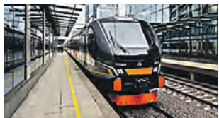
Новые городские вокзалы делают поездки более удобными

— Сегодня мы с РЖД ведем строительство «Петровско-Разумовской» МЦД-1 и «Митьково» МЦД-3. Продолжается реконструкция «Беговой» МЦД-1 и «Рижской», которая в будущем объединит второй, третий и четвертый диаметры, — рассказал в своем блоге мэр столицы Сергей Собянин.