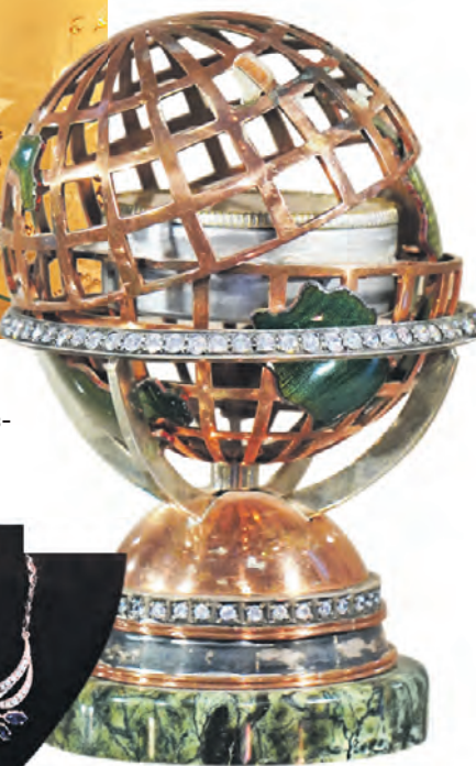
Медная шкатулка «Вокруг света». 2023