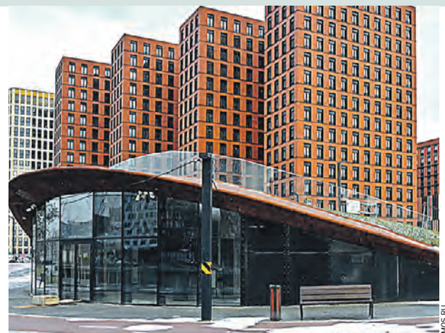
Завершился второй этап благоустройства набережной Марка Шагала на месте бывшей промзоны ЗИЛ

Напомним, что в этом году также состоялось открытие автомобильного моста, связавшего набережную Марка Шагала и Южнопортовую улицу. Его строительство продолжалось более двух лет, начавшись в феврале 2021 года. Он помог разгрузить Варшавское шоссе и проспект Андропова.