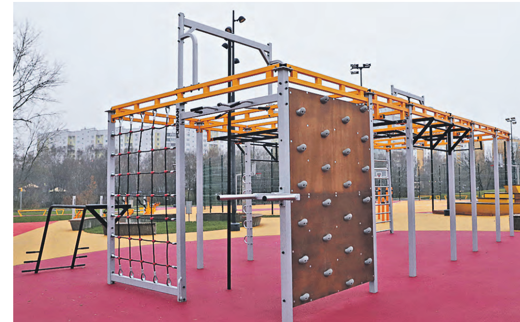
Спортивный кластер в долине реки Шмелевки оборудован по единому городскому стандарту