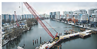
Строительство нового велопешеходного моста через Нагатинский Затон идет полным ходом

Всего за 12 лет в городе построили 31 автомобильный мост — например, Карамышевский мост, который пересекает канал имени Москвы и входит в состав Северо-Западной хорды, и переправу через реку Сходню. — В планах на ближайшие несколько лет — возвести еще семь автомобильных и семь пешеходных мостов, — заявил мэр Москвы Сергей Собянин.