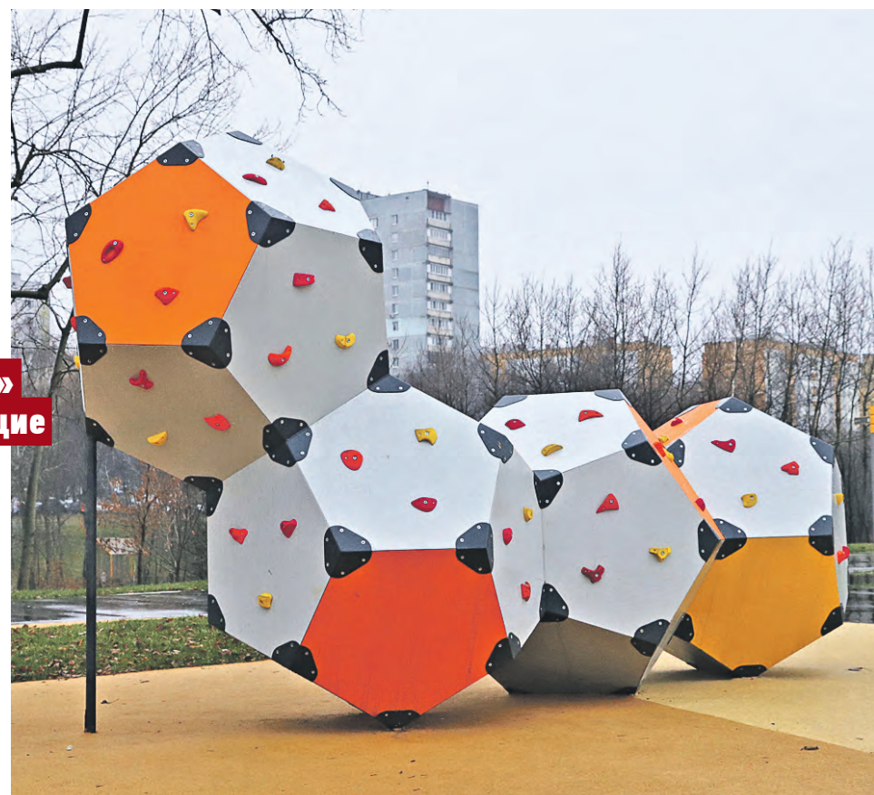
Благоустроенная детская площадка в долине реки Шмелевки