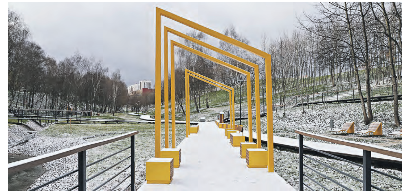
Тропинки из эконастила, проложенные по всей территории парка, идеально подходят для неспешных прогулок